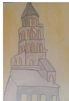
ZVONIK SVETOG DUJE