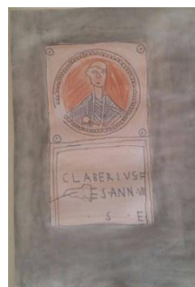
LOPTA I GAJ LABERIJE